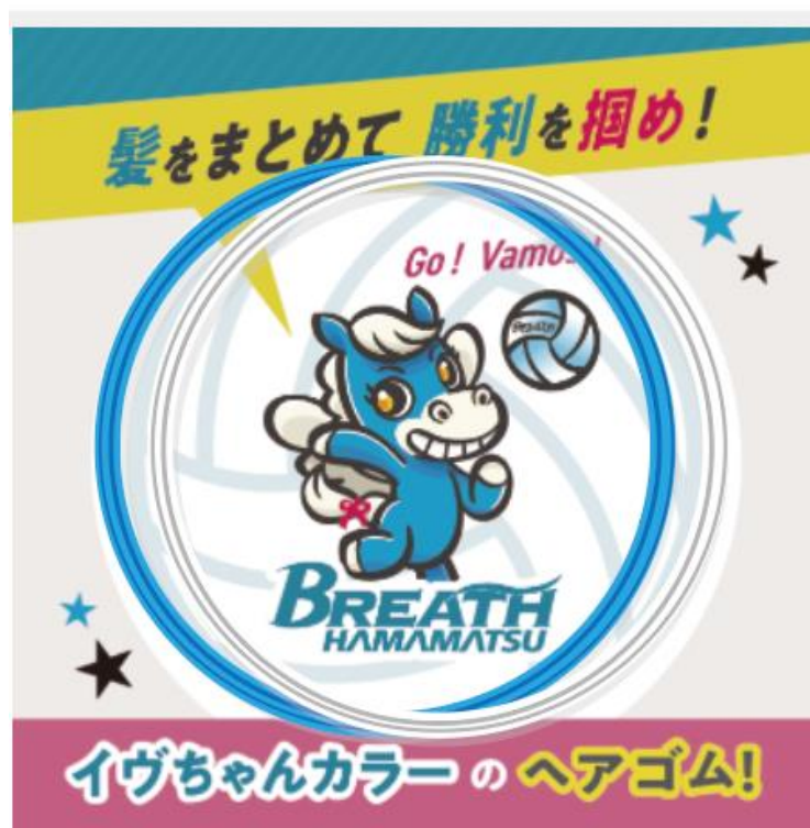
「KKOOR×ブレス浜松」パッケージ イメージ

「KKOOR」は、NOK初のBtoC商品として2024年2月より発売しています。汗・水に強く、耐久性に優れており、また、髪をしっかり固定しつつ、簡単に外すことができる点が特徴です。発売以