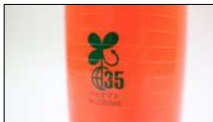
「ポストコーン」バイオマスタイプ