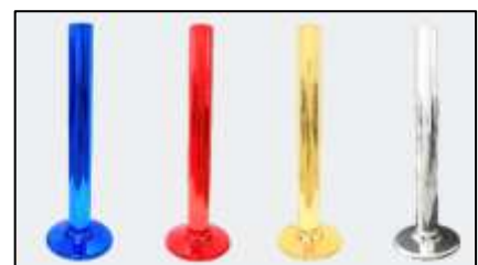
Post Original Design

※「TF コート」「Le-μ's」「sotto」「メックスフロン\MEXFLON」「ポストコーン」は NOK の登録商標です。