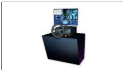
ザ・サイバードライバー