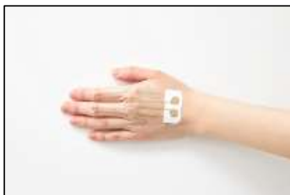
ストレッチャブル FPC

ストレッチャブル FPC を手の甲に貼りつけ、ねじったり、引っ張ったり、実際の使用感をお試しいただけます。FPC のスイッチ部分にライトをつなぎ、点灯するかご覧いただけます。