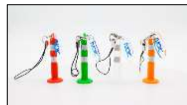
ミニ「ポストコーン」ストラップ4種