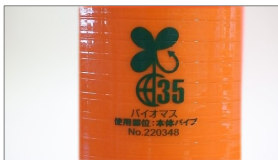
バイオマスマーク取得済

「ポストコーン」バイオマスタイプは、本体のパイプ部分に 39%の植物由来のポリマーを採用し、従来の製品に使用しているポリウレタンエラストマーと同等の特性を持ちながら、使用原料(ポリマー)の製造過程における CO 2 排出量を約 40%削減することが可能になりました。「ポストコーン」の役割である交通の円滑化、安全性を維持したまま、石油資源由来ポリマーの使用を削減、環境負荷を低減します。