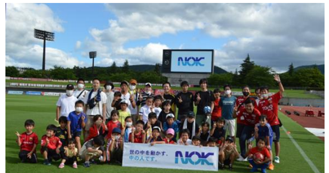
<2022年の「NOK スペシャルマッチ」、サッカー教室の様子>