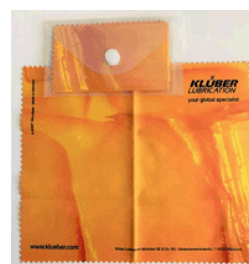
ノベルティ例：メガネクロス

本件リリースに関するお問い合わせ NOK 株式会社 広報部 (03) 6891-0191