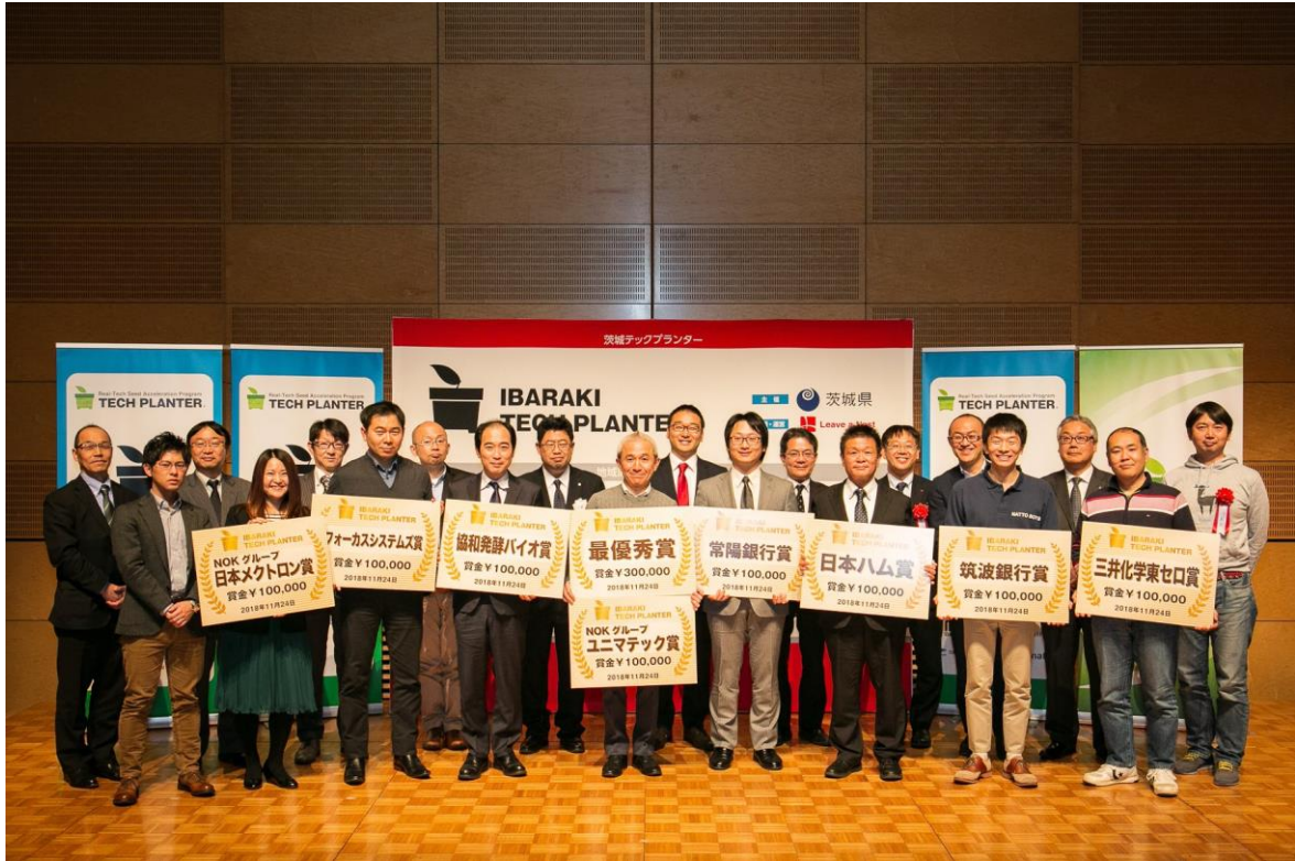
表彰式後の記念撮影