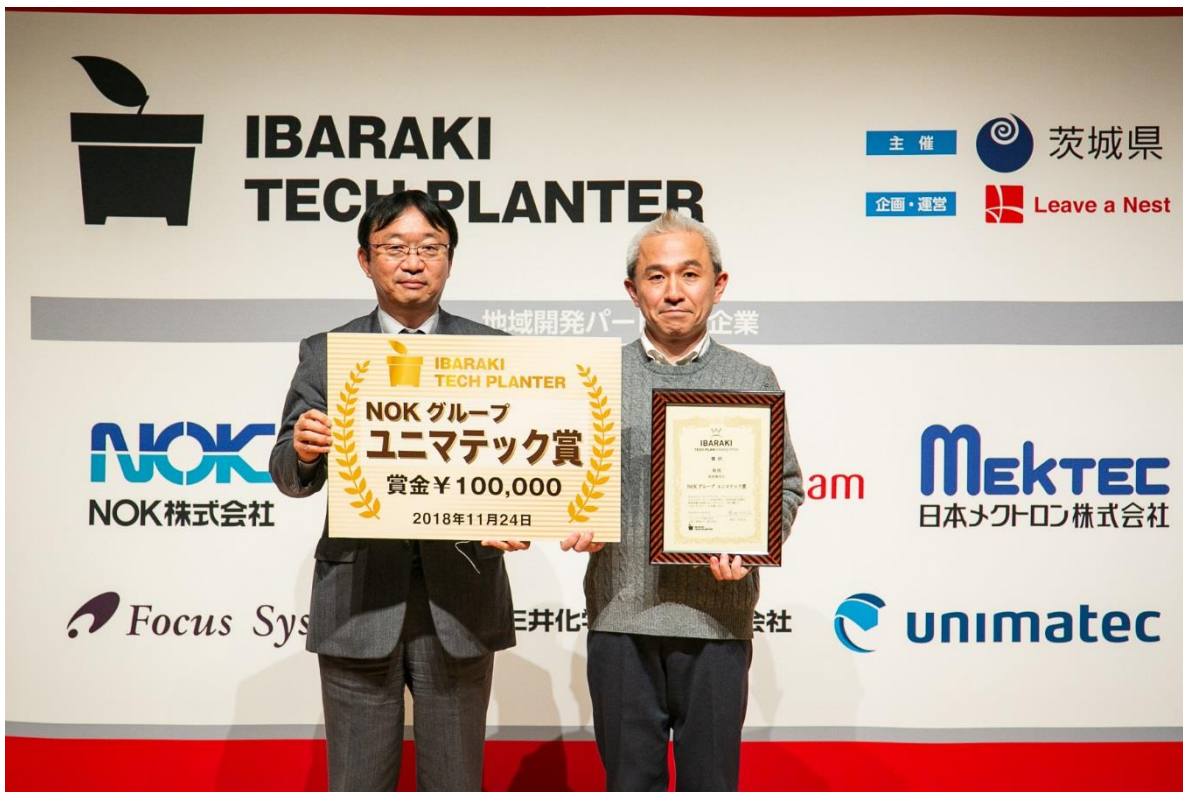
チーム有用にはユニマテック賞を授与