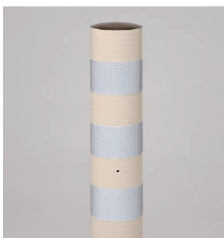
グレーベージュ 景観配慮色