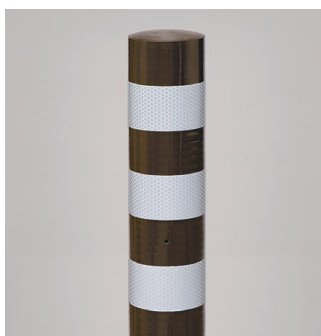
ダークブラウン 景観配慮色