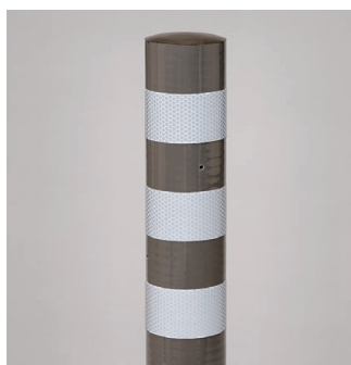
ダークグレー 景観配慮色