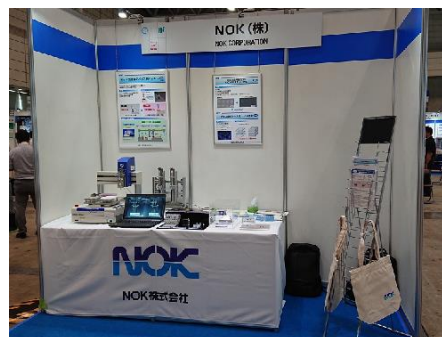
昨年のブースの様子

生体粒子を1個単位でAIが識別する「ポアセンサモジュール」など、マイクロ流体デバイス関連部品のご提案をさせていただきます。