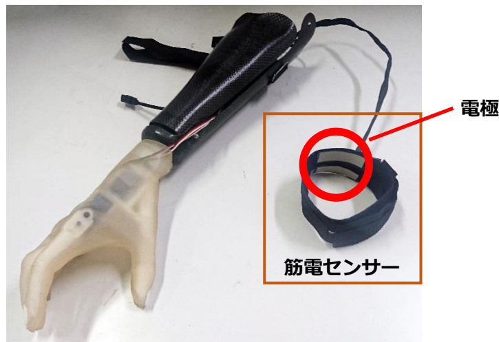
筋電義手

筋電義手では、モーターを動かすためのスイッチとして表面筋電位を使います。表面筋電位は、皮膚に接した電極を通じて筋電センサーが読み取ります。表面筋電位の信号特徴が、予め登録された手指動作ごとの特徴と一致すると、筋電義手が動作する構造です。